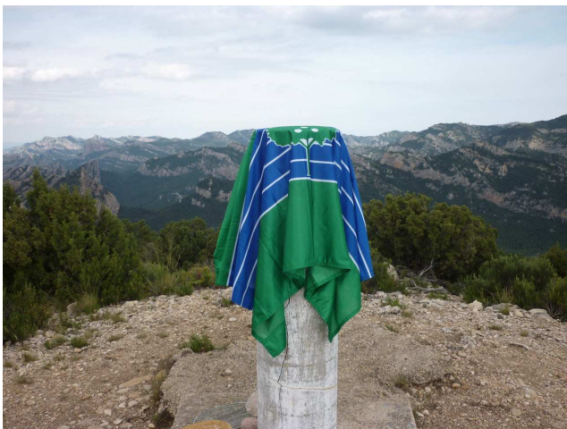
Cim del Penyagalera