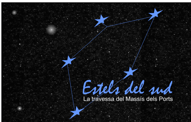
Travessa Estels del sud