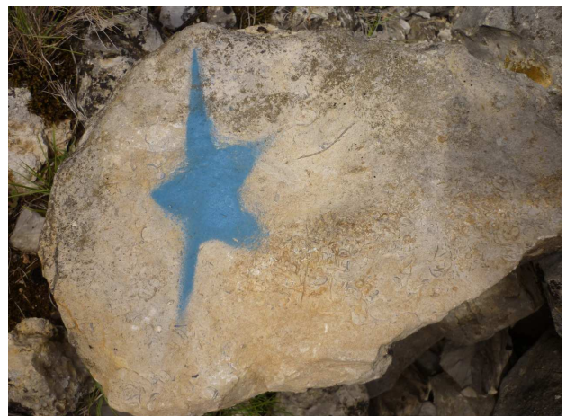
Senyalització de la ruta