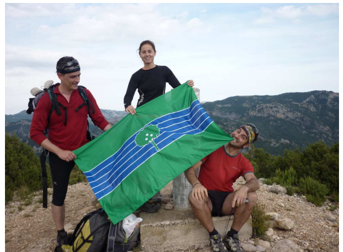
Cim del Penyagalera